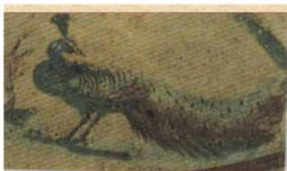
Το παγόνι σύμβολο αθανασίας (Κατακόμβη Πρίσκιλας)