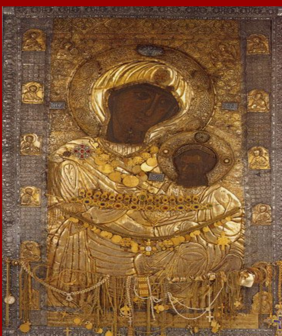
ΠΟΡΤΑΙΤΙΣΣΑ – Ι.Μ. ΙΒΗΡΩΝ