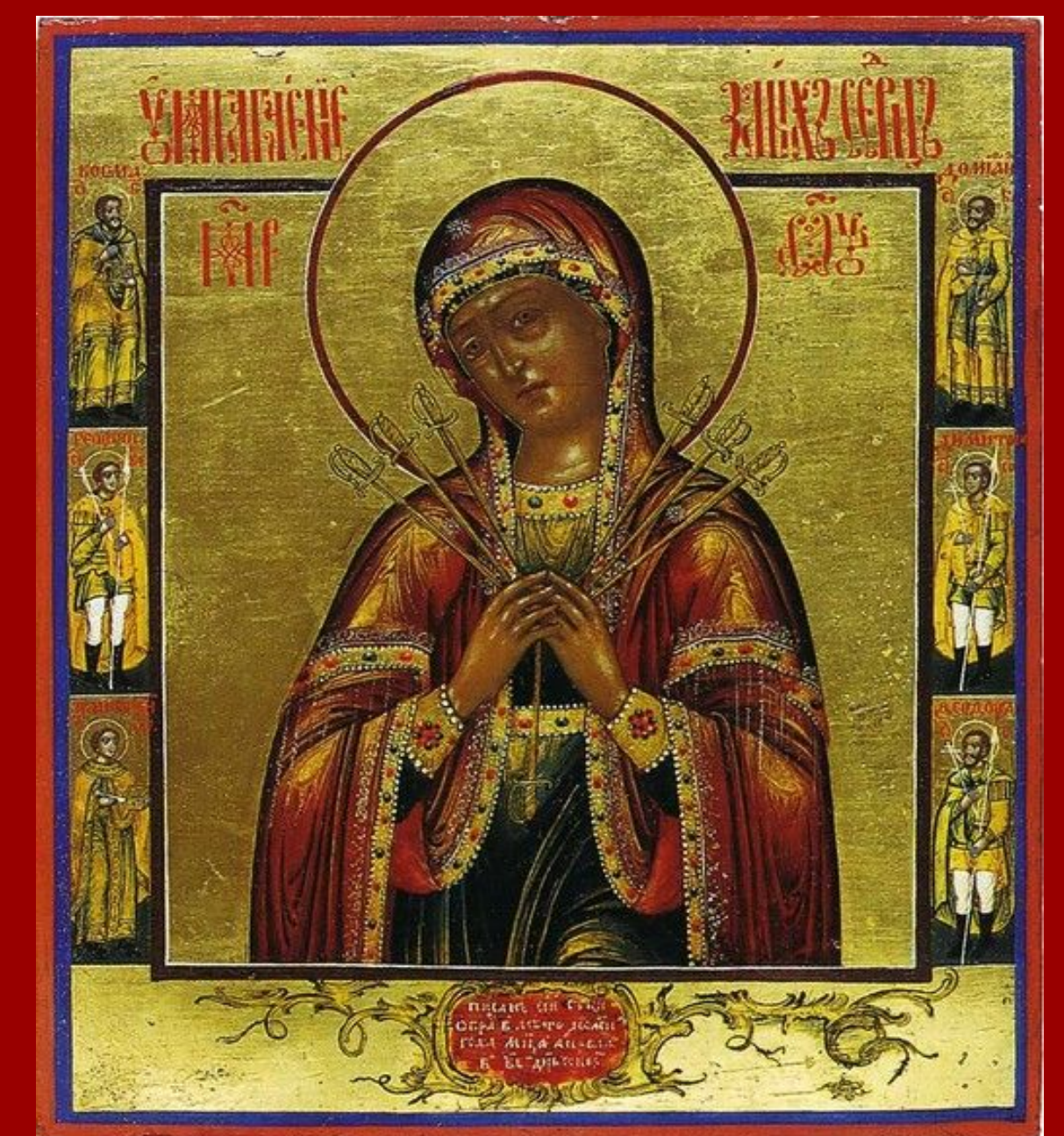
ΜΕ ΤΑ ΕΠΤΑ ΣΠΑΘΙΑ