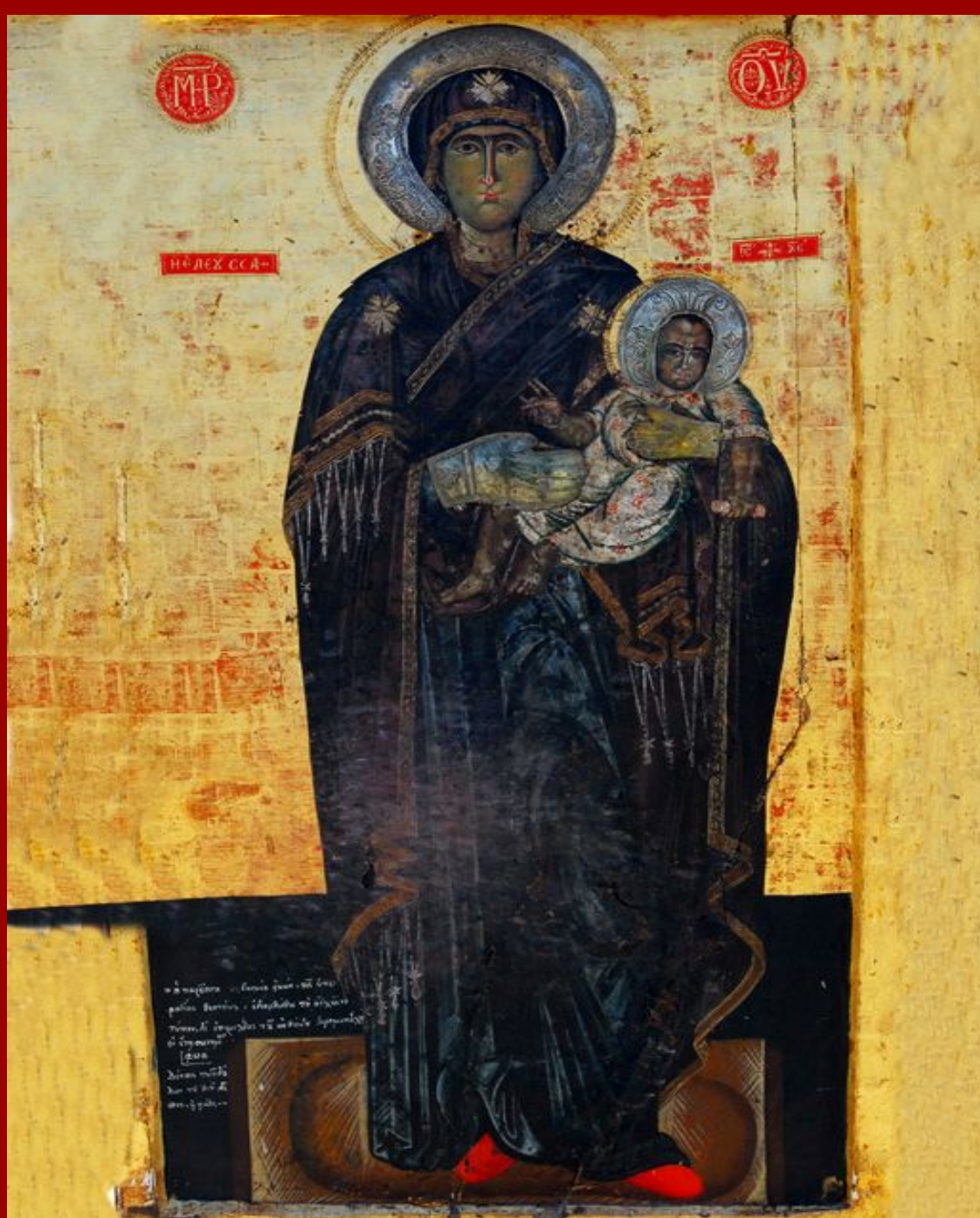
ΟΡΘΟΚΡΑΤΟΥΣΑ - ΣΠΗΛΙΩΤΙΣΣΑ

Ἄξιόν ἐστιν ὡς ἀληθῶς μακαρίζειν σε τὴν Θεοτόκον, τὴν ἀειμακάριστον καὶ παναμώμητον καὶ Μητέρα τοῦ Θεοῦ ἡμῶν. Τὴν τιμιωτέραν τῶν Χερουβείμ καὶ ἐνδοξοτέραν ἀσυγκρίτως τῶν Σεραφείμ, τὴν ἀδιαφθόρως Θεὸν Λόγον τεκοῦσαν, τὴν ὄντως Θεοτόκον, σὲ μεγαλύνομεν.